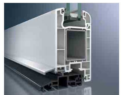
Schüco Corona CT 70 Haustür mit barrierefreier Türschwelle aus Kunststoff